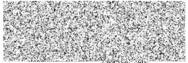
Petr Divílek vedoucí střediska