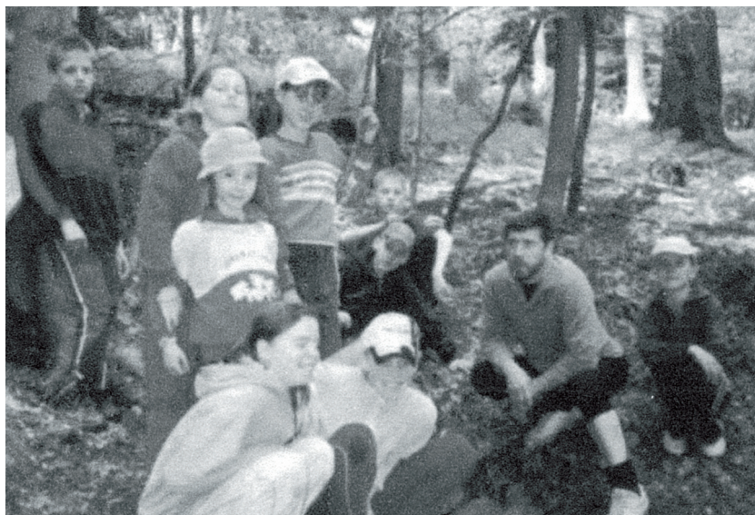
Malí účastníci pod dohledem vedoucího oddílu