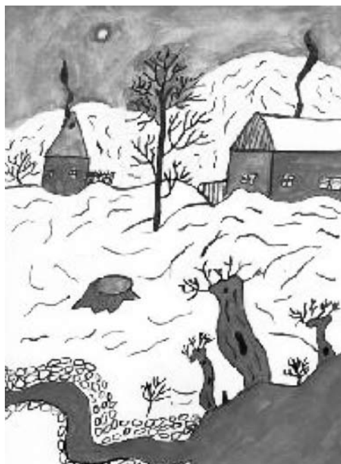
Vítězný obrázek Damiána Gerži