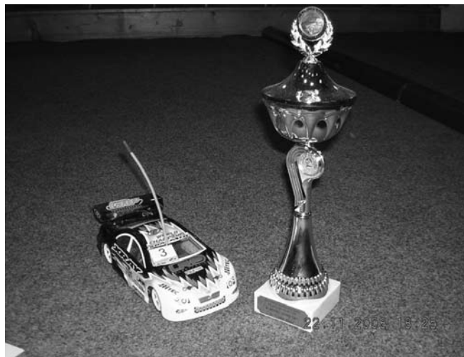
Fanánekovo auto i s pohárem z mistrovství republiky

a nejrychlejší a jezdí ji dohromady se seniory. Jsou to již za ty tři roky ostřílení borci.