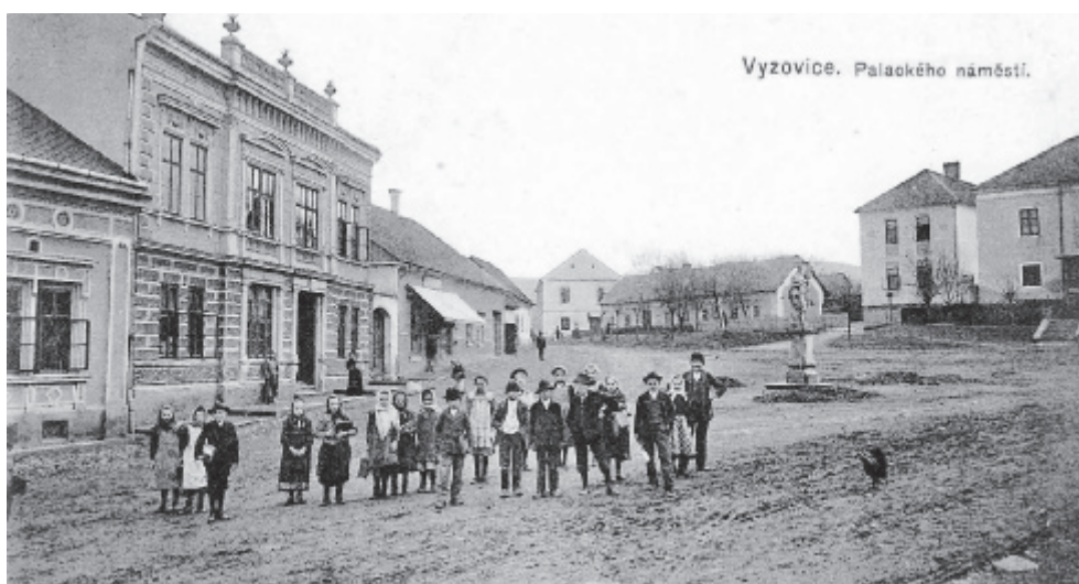
Vydal Rudolf Macháček, 1908, zapůjčil Jiří Madzia.