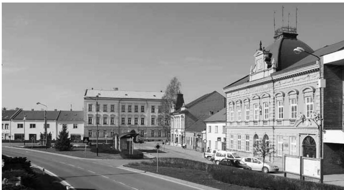
Masarykovo náměstí, Vizovice, březen 2010.