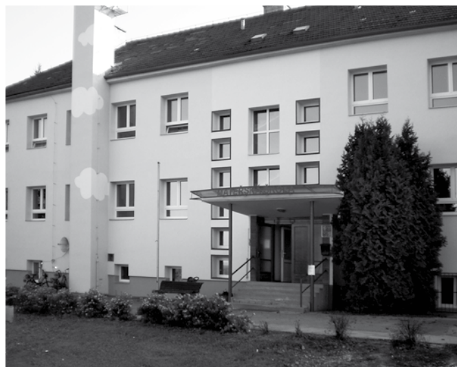
Dolní budova MŠ po rekonstrukci.