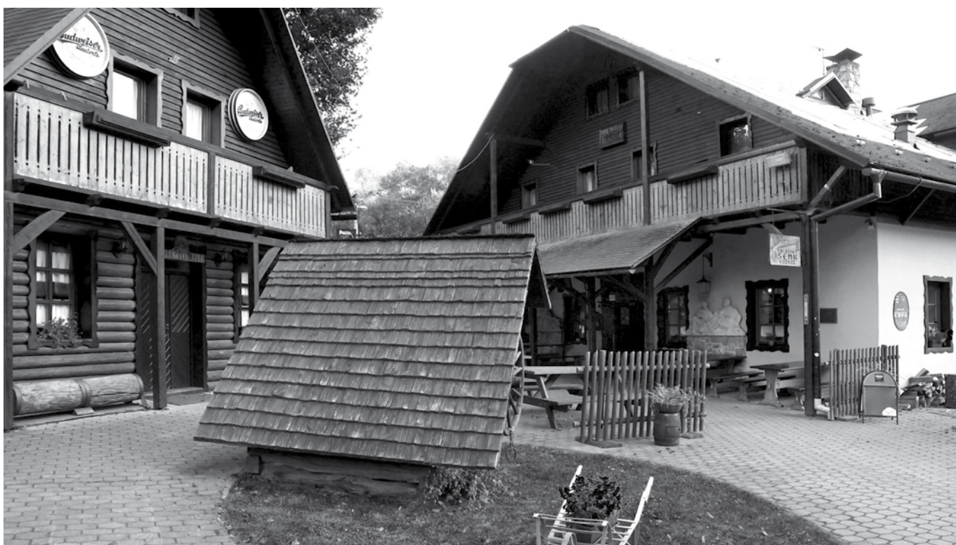
Vizovice, Valašský šenk, září 2010, foto Radek Mládenka.