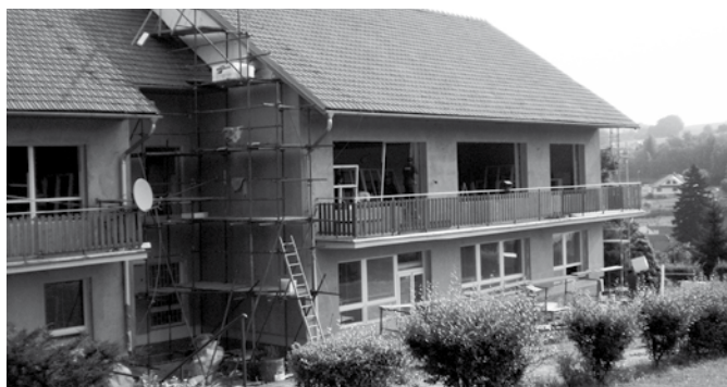
Horní budova MŠ v průběhu rekonstrukce.