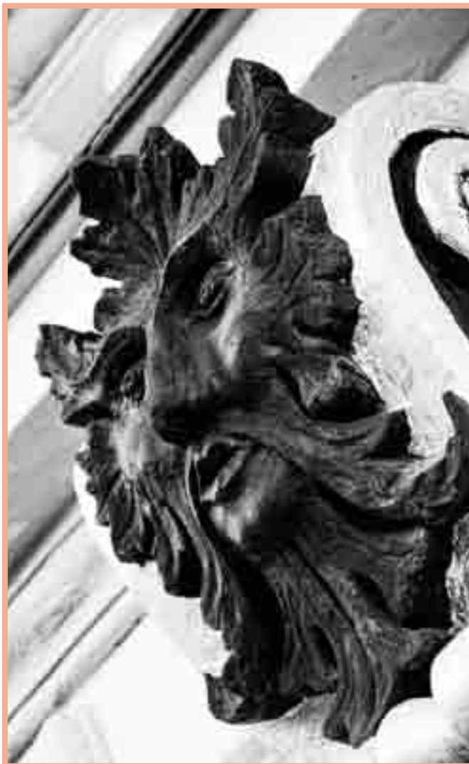
Zelený muž ve Vizovicích.

Jak bylo popsáno výše, Zelení muži jsou spojováni s rohatými božstvy, s bohy našich otců. Tehdejší kultury uctívaly přírodu a Zelený muž byl pro ně jakýmsi spojením s ní. Přesto však nastává otázka, co dělá pohanský bůh na křesťanských katedrálách a kostelech? Během christianizace tehdejší pohanské Evropy probíhalo několik procesů vykořevení starých zvyků a božstev. Církev si byla moc dobře vě-