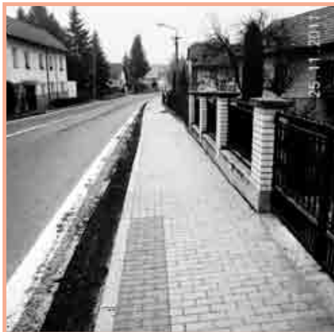
Nová tvář chodníků na Říčanské