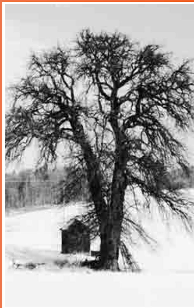
Stromy jsou naším kulturním bohatstvím.