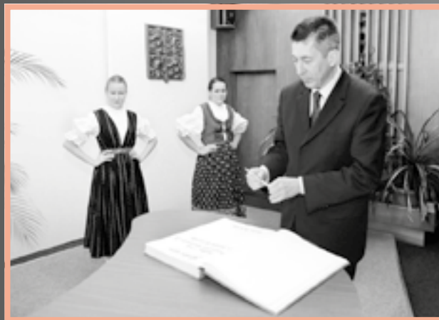
První rada Francouzského velvyslanectví Nicolas de Lacoste.