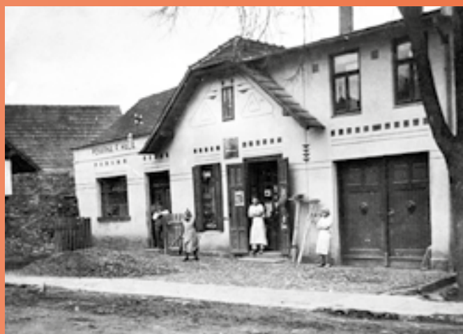
Halovo pekařství v letech 1925–1928.