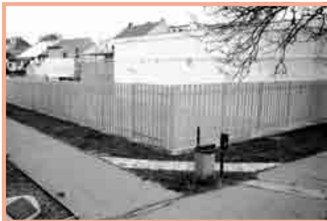
Nové oplocení za prodejnu Albert.