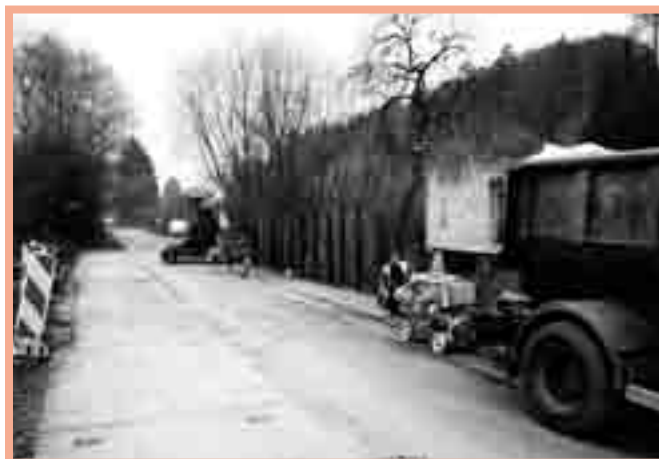
Ulice Lázeňská „za točnou“.