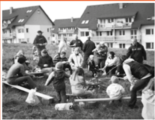
Posezení rodičů s dětmi u táborového ohně.

v tomto adventním čase nám dovolu, abychom Vám přiblížili činnost Občanského sdružení Janova Hora Vizovice v roce 2011. OSJHV vzniklo v prosinci 2009 za účelem zlepšování životních podmínek obyvatelů Vizovic, zejména obyvatelů sídliště Janova hora. V současné době má OSJHV 60 členů. Snažíme se dlouhodobě o zvelebení sídliště a vytvoření příjemného prostředí pro obyvatele, v první řadě pro naše nejmenší.