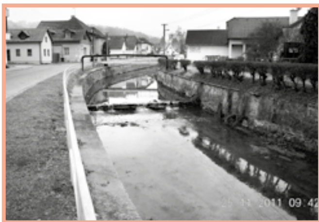
Bratřejůvka na Pardubské ulici.