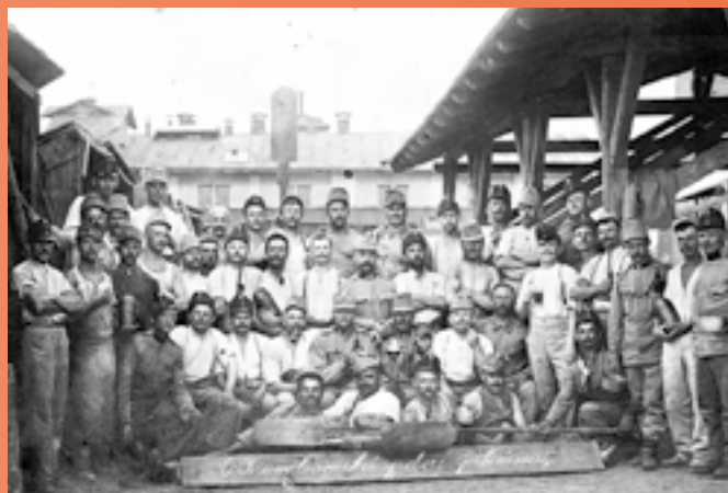
I. sv. válka – Fr. Hala (šestý zprava – muž s pivem) – C.K. Zěmebranecká polní pekárna.