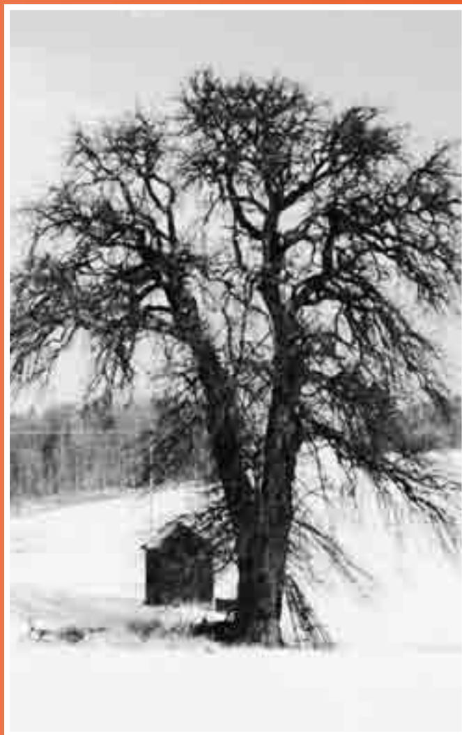
Stromy jsou naším kulturním bohatstvím.