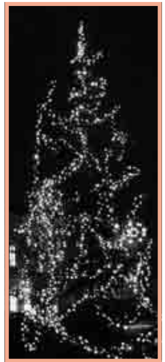
Nová tvář vánočního stromku.