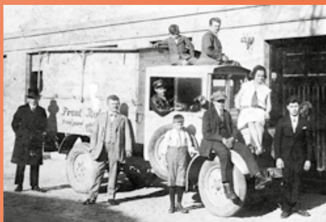
Přibližně rok 1930, rodina s Halova s firemním vozidlem na ulici Říčanské.